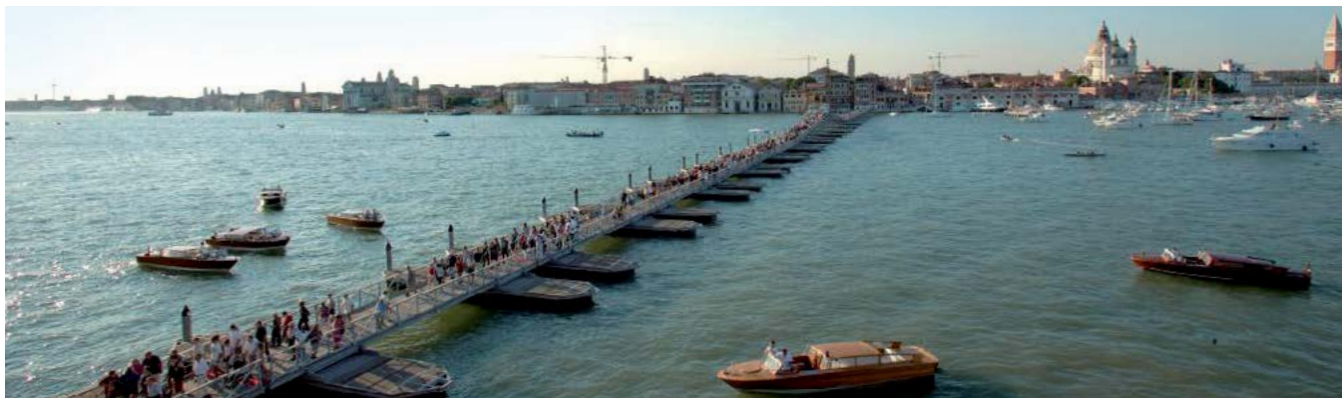
Canale della Giudecca ponte galleggiante temporaneo per la festa del Redentore