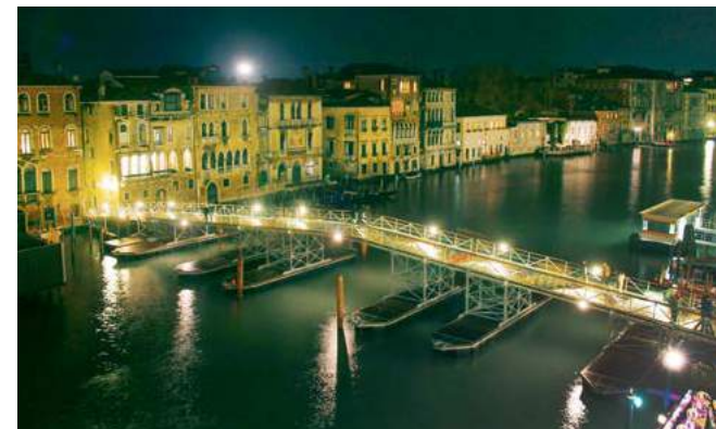
Canal Grande ponte galleggiante temporaneo per la Festa della Madonna della Salute