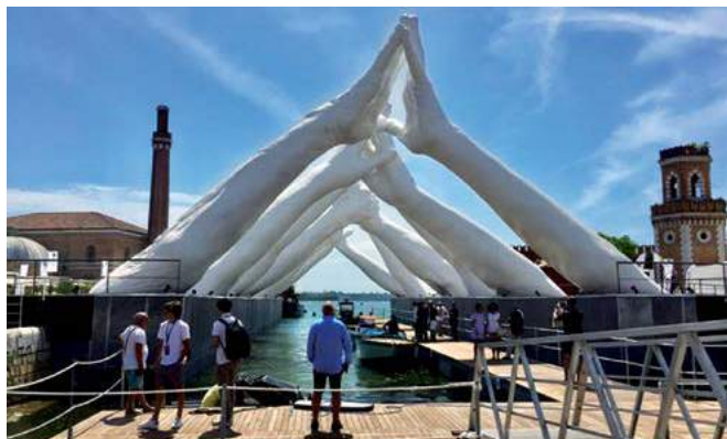
Bacino dell'Arsenale Salone Nautico di Venezia