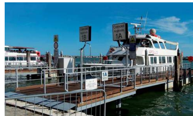
Bacino di San Marco piattaforme ormeggio battelli