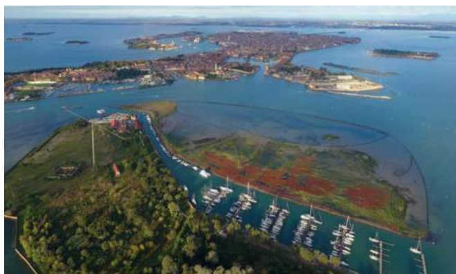
Isola della Certosa Venezia Certosa Marina