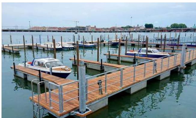
Isola del Tronchetto approdo galleggiante per i mezzi della Polizia Locale