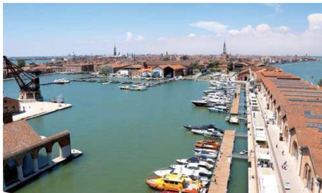
Bacino dell'Arsenale Salone Nautico di Venezia e pontili enti di stato