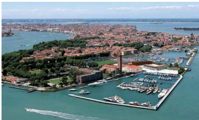
Isola di Sant'Elena Marina Santelena